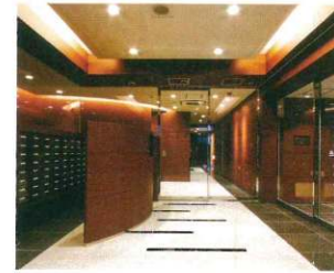
エントランスの天井をもとと2.8mのところを3.23mに高くすることで、入居者に合わせたエレガントな空間を演出