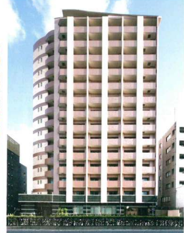
1Kから3LDKまでの間取りを用意。単身者のほか、家族での利用も見込む

経営計画づくりや設計・施工会社の選定、建築の管理、融資の債務保証までしっかりとサポートしてくれる首都圏不燃建築公社の「公社譲渡システム」。実際に活用したオーナーの事例から、その魅力を探った。